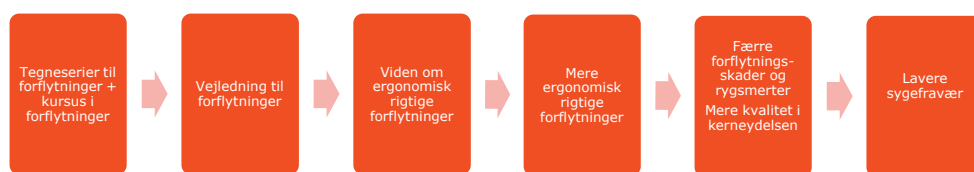
Figur 1 Projektets forandringslogik